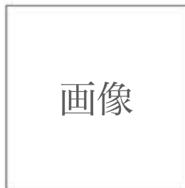
図 高橋由一「山形市街図」

また、三島は ㉒ 高橋由一 に依頼して、開発の様子を絵画に描き留めさせている。図に示した高橋の絵には、洋風の建築物が整然と並ぶ山形の市街地が描かれている。建築を通して、新しい時代を目に見える形で表現する。これが三島の考えた文明開化の姿であった。